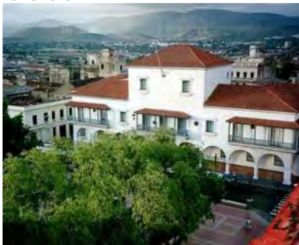
Santiago de Cuba

Cuba. Entre este martes y el próximo lunes 1 de noviembre se celebra en el oriente de este país el congreso de la Asociación Empresarial de Agencias de Viajes Españolas (AEDAVE), al que asistirán la directiva de la entidad, personalidades del turismo internacional y más de 150 agentes de viajes e invitados. El evento incluirá sesiones y otras actividades en Santiago de Cuba, Bayamo y Guardalavaca (Holguín).